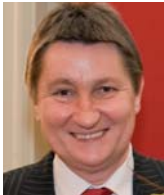
Moderation Ulli Zelle, rbb

Interessierte, Betroffene und ihre Familien sind herzlich eingeladen, sich mit den Experten auszutauschen und an Informationsständen über Hilfsangebote zu informieren.