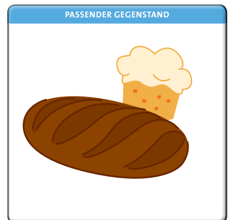
Brot und Kuchen