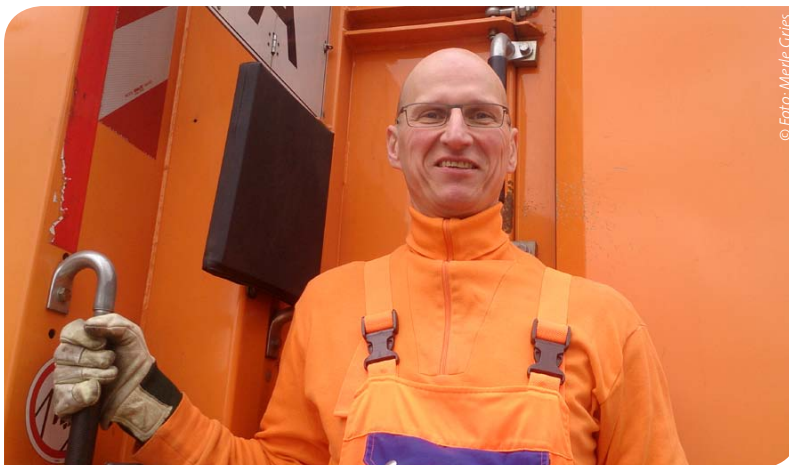
Ulli liebt seine Arbeit.