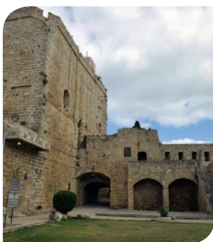
Reste der Burg der Kreuzritter von Akkon in Israel

Darüber zerbrechen sich Wissenschaftler schon lange die Köpfe. Inzwischen sind viele überzeugt: Wenn irgendwo ein Konflikt ausbricht, bei dem Religion eine Rolle spielt, hat es meistens schon vorher Probleme zwischen den Menschen gegeben. Die Religion ist dann nur der Vorwand, um Krieg zu führen, um etwas zu erreichen, das nichts mit der Religion zu tun haben muss. Gewalt im Namen des Glaubens kann sich gegen Völker mit einem anderen Glauben richten oder gegen Einzelne. Sogar zwischen Anhängern derselben Religion kommt es zu Gewalt. Hier findest du einige Beispiele: