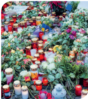
Kerzen für die Opfer des Terroranschlags auf dem Breitscheidplatz in Berlin

verboten, mit nicht-jüdischen Kindern zur Schule zu gehen, und sie mussten einen gelben Stern aus Stoff tragen, damit jeder sie als Juden erkennen konnte. Hitlers Ziel war es, alle Juden in Europa zu vernichten. Dazu wurden Millionen von ihnen in Konzentrationslagern ermordet. Als die Herrschaft Hitlers beendet war, waren sechs Millionen Juden tot. Viele Gedenkstätten erinnern an die schlimme Zeit, damit so etwas nicht mehr passiert. Heute gibt es in Deutschland wieder mehr als 100 jüdische Gemeinden.