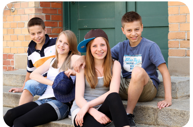
Der richtige Schuh zum Glück? Kaufen, was angesagt ist? Mit dem Versprechen: Dann gehörst du dazu?

Aber ganz ehrlich, glaubst du wirklich, dass allein die Tatsache, dass du das gleiche frühstückst wie ein Nationalspieler oder dieselben Schuhe trägst wie einer deiner Stars, dich langfristig glücklich macht? Gut, wenn man Werbung durchschaut.