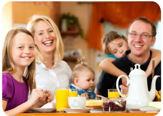
Die ideale Werbefamilie – gute Stimmung mit dem richtigen Frühstück

Wenn du dir Werbeanzeigen oder Werbespots einmal ganz genau ansiehst, wirst du schnell merken, dass meistens nicht nur das angepriesen wird, was das Produkt wirklich leistet und wofür es gut ist. In der Werbung macht ein Joghurt oder eine Wurst eben oft nicht nur satt und schmeckt, sondern es gibt ein Glücksversprechen dazu. So wird zum Beispiel der Joghurt, das Müsli, die Marmelade von einer fröhlichen Familie gegessen, die zusammen viel Spaß hat. Und wer will nicht so fröhlich am Frühstückstisch sitzen wie die Werbefamilie? So vermittelt die Werbung den zusätzlichen Eindruck, dass sich alle beim gemeinsamen Essen dieses Joghurts oder eines bestimmten Müslis wunderbar verstehen.